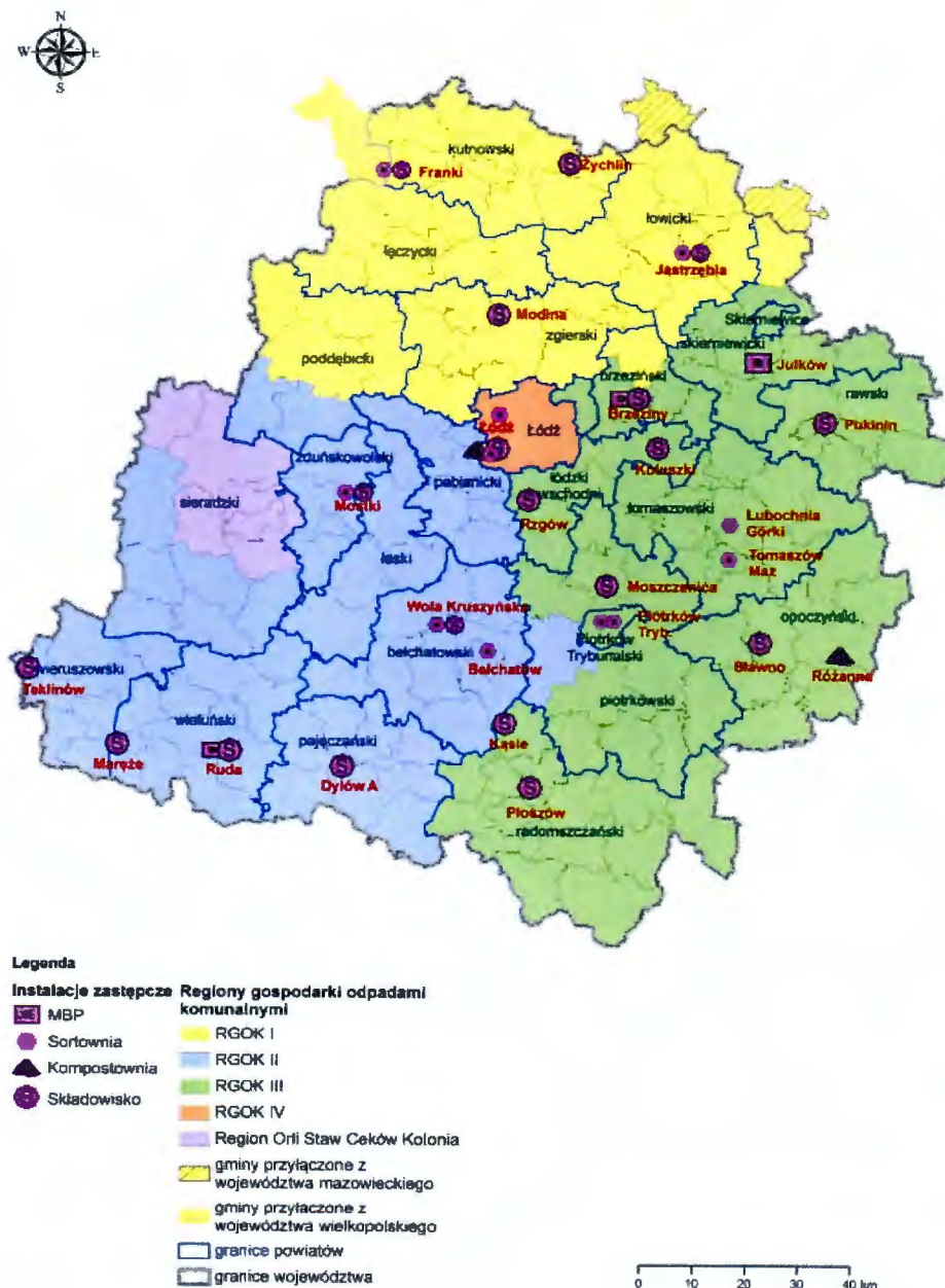
Rysunek 2 - Instalacje zastępcze na terenie województwa łódzkiego

Zgodnie z „Planem Gospodarki Odpadami dla Województwa Łódzkiego 2016-2022” Gmina Przedbórz należy do Regionu III.