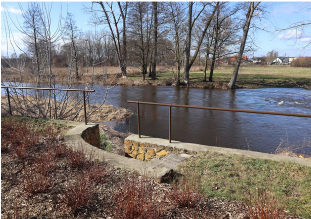
ul. Krakowska - Przedbórz