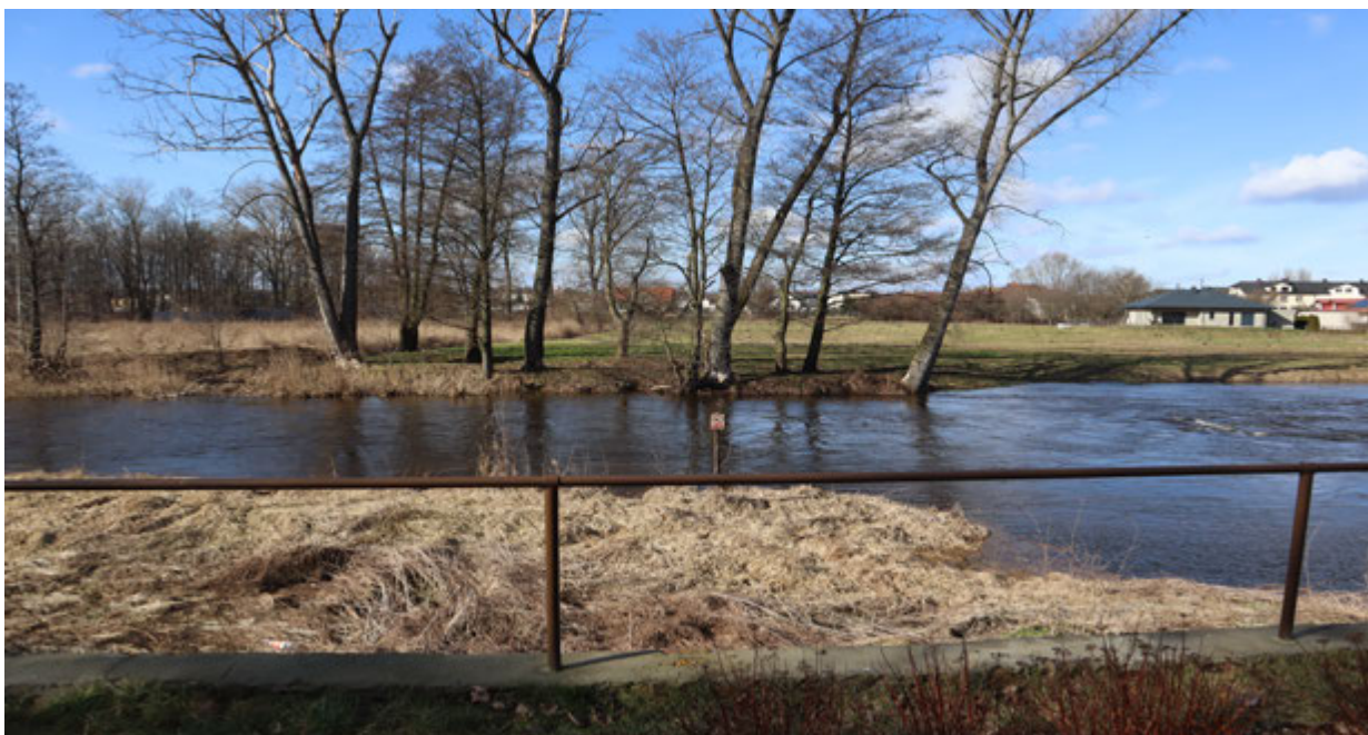
ul. Krakowska, Przedbórz

Czynnikami wpływającymi na bezpieczeństwo i ilość osób korzystających z walorów rekreacyjnych i turystycznych rzeki Pilicy są pogoda i pora roku. W okresie letnich wakacji liczba korzystających z kąpieli znacznie wzrasta, należy liczyć się wówczas ze wzrostem zagrożenia zachłyśnięć, utonięć, poparzeń i udarów słonecznych.