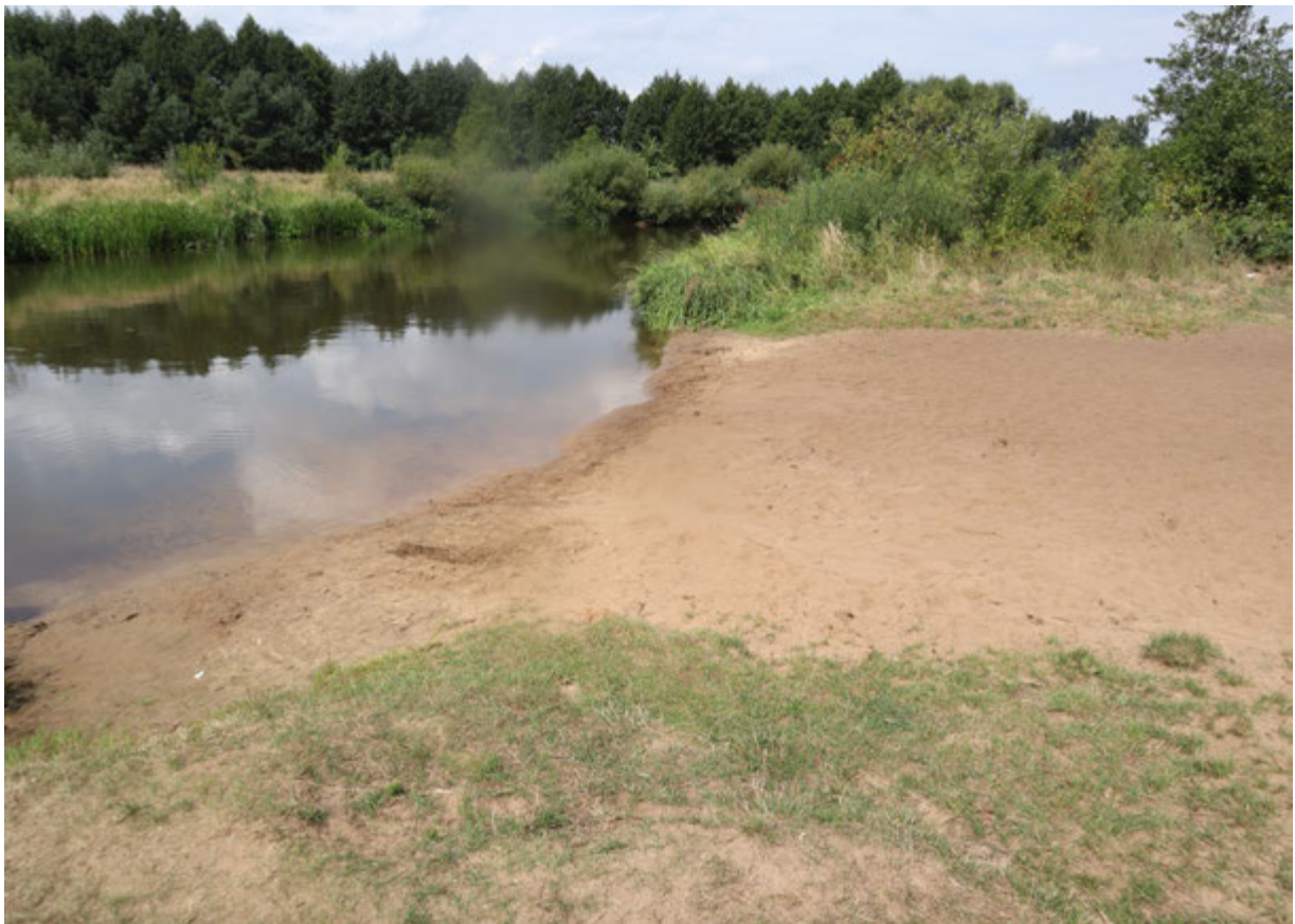
Błonia – Przedbórz